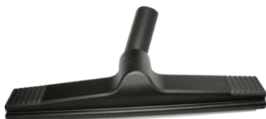
4205 Lavapavimenti componibile 40 cm