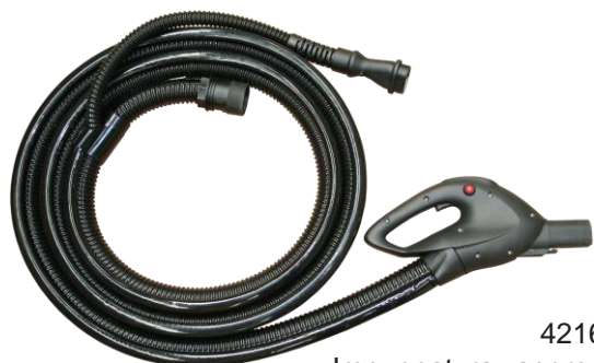
4216 Impugnatura vapore / detergente / aspirazione con tubo L = 4 mt