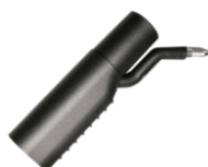
4209 Adattatore vapore + aspirazione