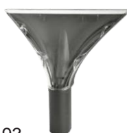
4193 Racla grande 23 cm