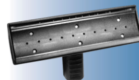
4197 Tergivetro 23 cm