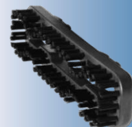
4203 Telaio setolato per bocchetta 4198