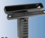
4198 Bocchetta vapore + aspirazione 14 cm