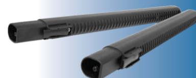
4204 Tubo prolunga vap. + asp. 50 cm